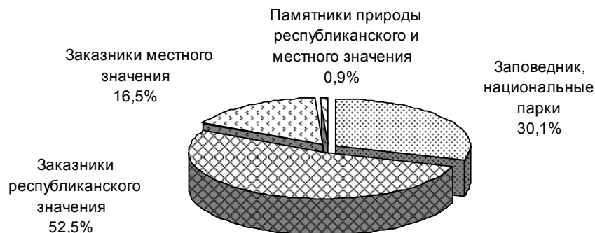
Рис. 9.1. Структура ООПТ Беларуси в 2009 г.

*Без Полесского радиационно-экологического заповедника.